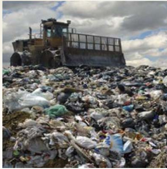
RIFIUTO ORGANICO IN DISCARICA