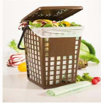
SVILUPPO DI SISTEMI PER LA RACCOLTA DIFFERENZIATA DEL RIFIUTO ORGANICO ATTRAVERSO LE BIOPLASTICHE