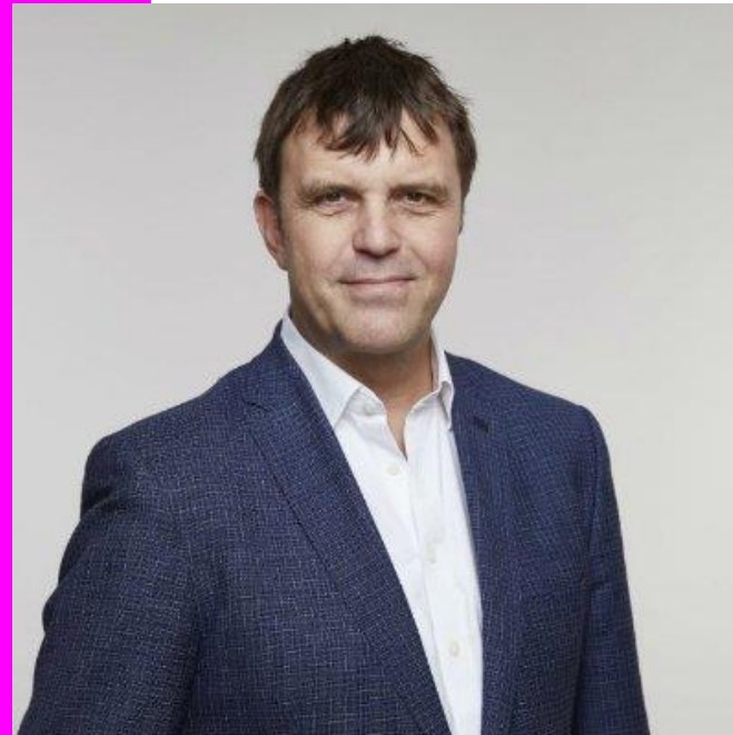
Nigel Topping , UK High Level Climate Action Champion

Race to Resilience mobilita la partecipazione e il sostegno di città, regioni, imprese e investitori per aiutare le comunità in prima linea a costruire la resilienza e ad adattarsi agli impatti del cambiamento climatico.